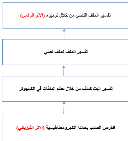
شكل 1: العلاقة بين الآثار الفيزيائية والرقمية

يبين الشكل التالي العلاقة بين الآثار الفيزيائية والرقمية: