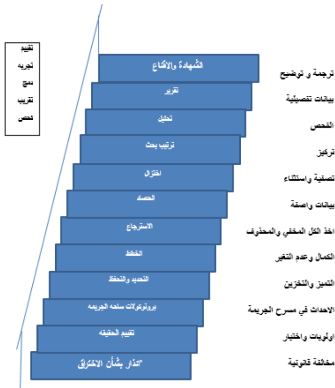
شكل 4: نموذج كاسي المقترح للتحقيق الإلكتروني 15