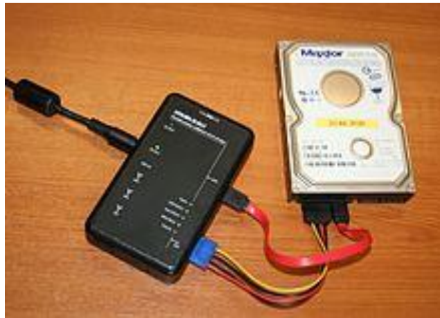
شكل 5: أدوات حفظ الدليل أثناء النسخ.

ويبين الشكل التالي كيف يتم ربط هذه الأدوات مع وسائل التخزين عند النسخ.